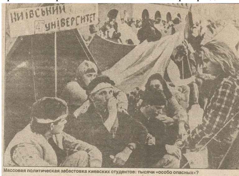
Массовая политическая забастовка киевских студентов: тысячи «особо опасных»?

В 1976 году Левко Лукьяненко, теперь депутат Верховного Совета республики, лидер Украинской республиканской партии, отбыл пятнадцатилетний срок, из них четыре месяца в камере смертников, ожидая, что его поволокут на расстрел. Таков был первый приговор за то, что Лукьяненко, в соответствии с конституцией, отстаивал идею референдума о самостоятельности Украины. Причем он обязывался, если народ решит, чтобы Украина